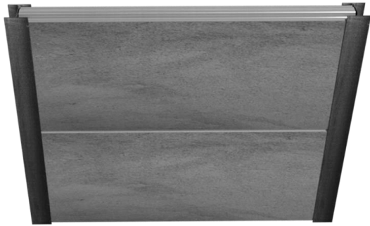
Muro en Posición Horizontal